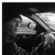
GONZO(野澤孝智) 音楽プロデューサー

武蔵野音楽大学声楽家卒業。音楽プロデューサーとして荻野目洋子等をプロデュース。SMAPをデビューから10年間担当し、「夜空のムコウ」など黄金時代を築きあげた。近年はアーティストとしても国内外で活躍中。